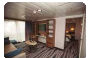
Cabina 420 – Cat. "A" (Tipo Lujo)