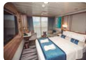
Cabina 714 – Cat. "D" (Tipo Intermedio)