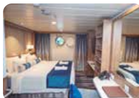
Cabina 301 – Cat. "G" (Tipo Estándar)